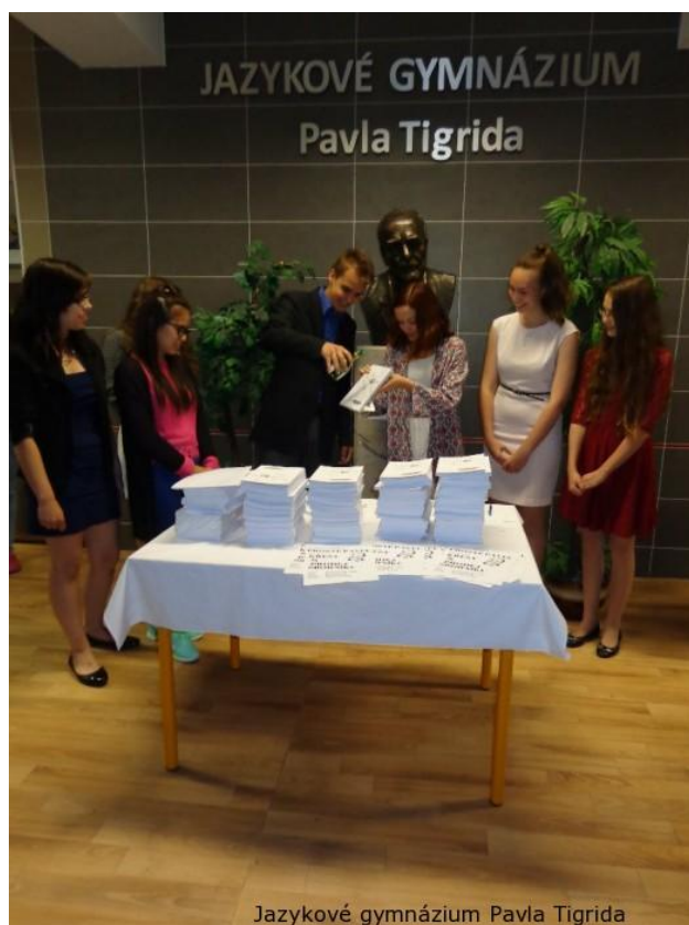
Jazykové gymnázium Pavla Tigrida

Křest sborníku studentských prací „Prostě Pavel“